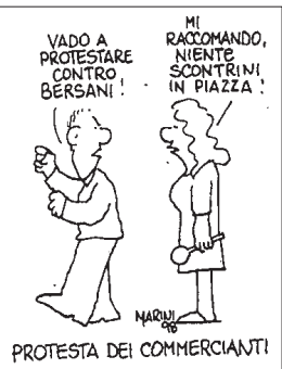
PROTESTA DEI COMMERCianti

Tanto tuonò che piovve, dunque, e i commercianti della «capitale» camuna sono scesi in campo (anzi, in piazza),