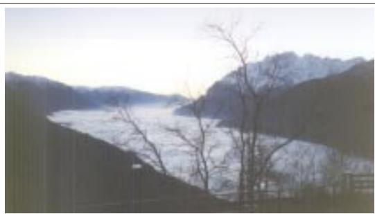
La Valcamonica vista dalla balconata della Valsaviore

A me, e non so a quanti altri, ha fatto un certo effetto leggere quotidianamente i nomi dei vari candidati alle prossime elezioni amministrative in valle. Candidati consiglieri e candidati sindaci. Li ho letti tutti, così per pura curiosità, per vedere se ci trovo un amico, un conoscente, un avversario (per modo di dire, in termini politici). E man mano scopro che certi nomi mi sono famigliari, che una generazione di vecchie volpi è tornata a insidiare i pollai. Certi sindaci che dopo la bufera tornano a prendere il sole, talvolta anche spudoratamente, tra candidati dalla pelle ancora immacolata. Altri non fanno il sindaco, ma fanno i consiglieri del sindaco, i suggeritori della politica, gli uomini ombra. Pensavamo di esserci sbarazzati di alcuni personaggi, dei soliti noti. Pensavamo ad una nuova primavera, alla fioritura di una nuova leva politica del dopo novantadue. Ci eravamo sbagliati. Loro, a volte tornano. La Legge Valtellina, la Leader due o tre, la metanizzazione, i fondi del Gal: sapete quanti miliardi brillano all'orizzonte. E chi poteva mancare? La vecchia guardia? Si esce da una porta e si entra dall'altra. Magari dalla stessa. Si è stati via poco. Il tempo di fumarsi in pace una sigaretta. Poi è tempo di rientrare. Dietro la lavagna ci sono stati anche troppo. E via di nuovo in sella. Forza camuni, arrivano i nostri. Niente paura, sono quelli di prima. (Guido Ceninì)