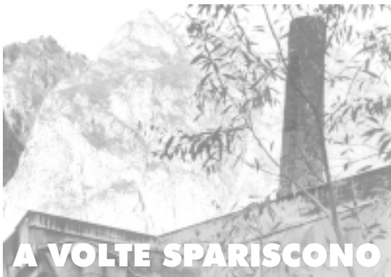
A VOLTE SPARISCONO Boario Terme: la ciminiera del vecchio cotonificio Olcese, demolita, nonostante un veto regionale, per far posto ad altri "interessi". Un altro pezzo di storia che se ne va...