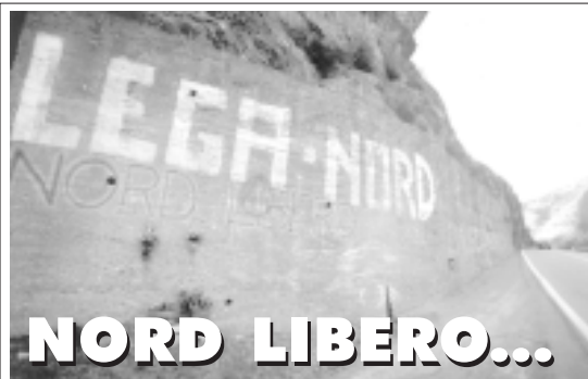
Sonico - marzo 2000