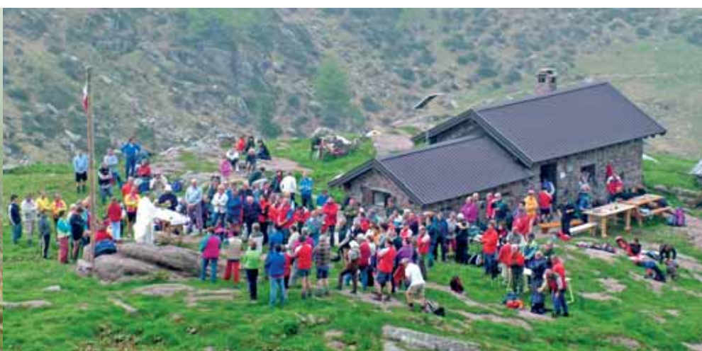
Sopra da sinistra: La firma dell'accordo di gestione - Giornata celebrativa al Marino Bassi Nel riquadro: il documento della proposta di collaborazione tra i Lupi di San Glisente e l'ERSAF